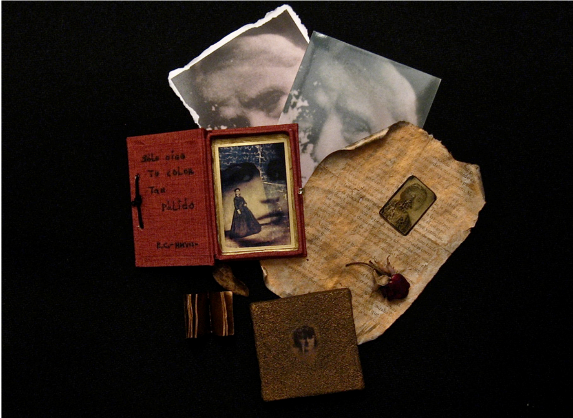
Sólo oigo tu color tan pálido - Serie: Evocaciones – Collage 2012