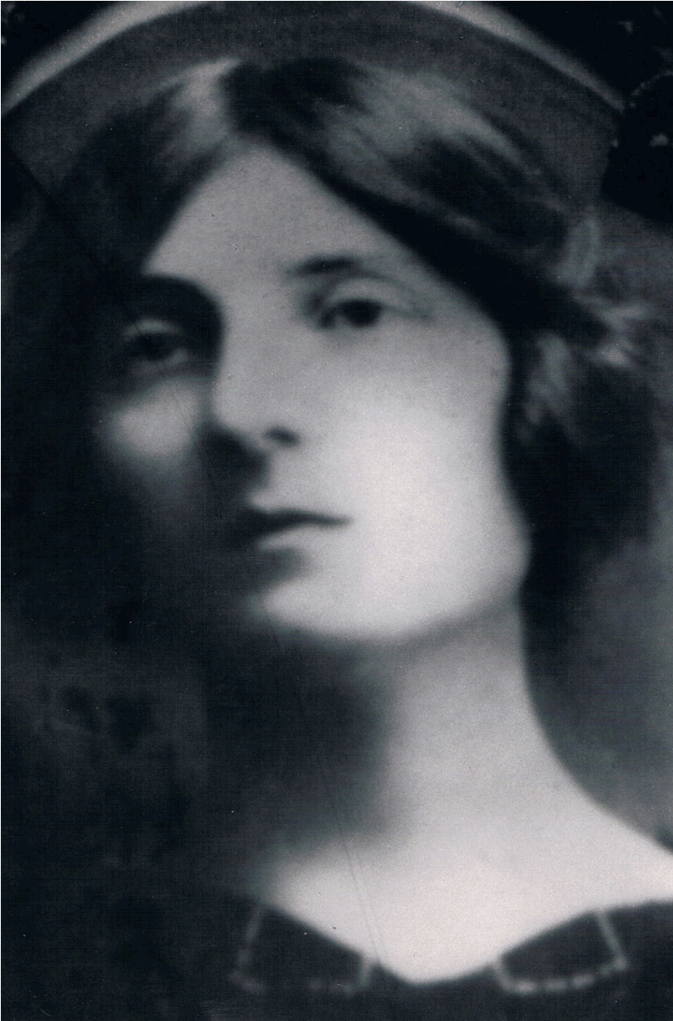
"Sólo me llevo tu recuerdo" Fotografía b/n - 2002