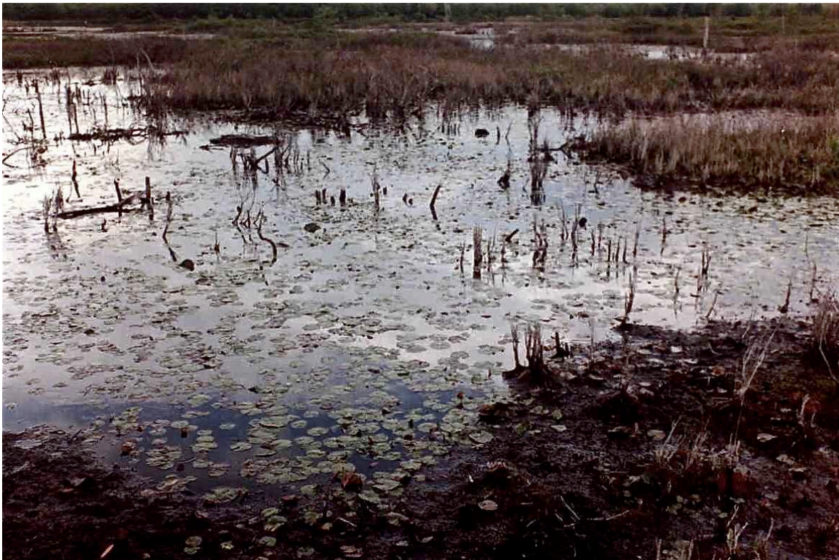
"La incolora bruma de la lejanía". Cibachrome, 2007