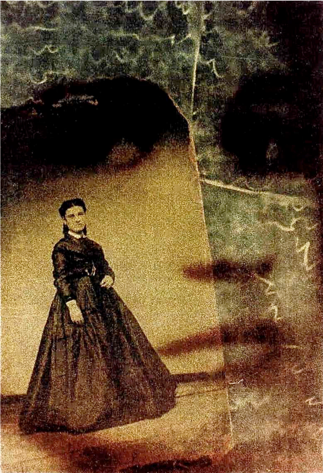
"Pero el rumor del poema permanece" – Serie poemas áureos – 2005 - marga clark