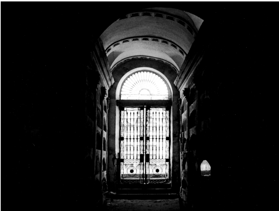
¿Dónde estás, amor... Fotografía b/n, 2005